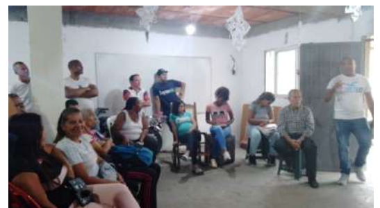
REUNIÓN PLAN TEXTIL COMUNAL NUEVO HORIZONTE