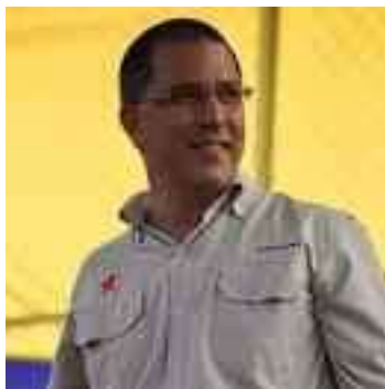
JORGE ARREAZA (MINISTRO)

Boulevard de Sabana Grande, Caracas 1040, Distrito Capital.