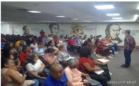
PRESENTACIÓN DEL BALANCE ADMINISTRATIVO DEL PLAN TEXTIL COMUNAL 2022

- Reunión del Circuito Económico Comunal Textil de Altos Mirandinos para la presentación de la rendición de cuentas del fondo de mantenimiento productivo por parte de las OSP textiles de carrizal, se realizó una evaluación colectiva de la confección y se dieron a conocer los avances del proceso administrativo del Plan Textil y las formas de distribución en las escuelas donde se van a realizar la entrega de los combos escolares.